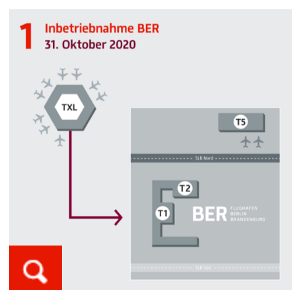
Inbetriebnahme BER 31. Oktober 2020