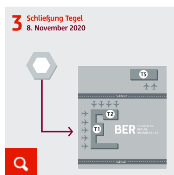
Schließung Tegel 8. November 2020