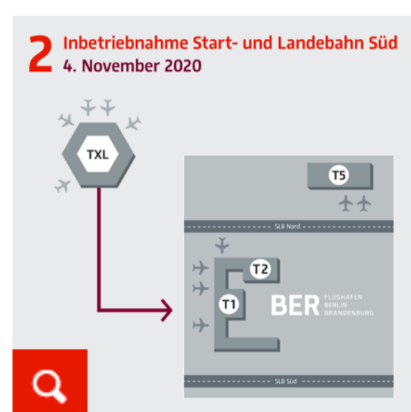
Inbetriebnahme Start- und Landebahn Süd 4. November 2020